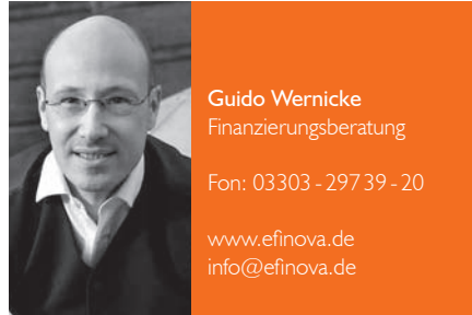
Guido Wernicke Finanzierungsberatung